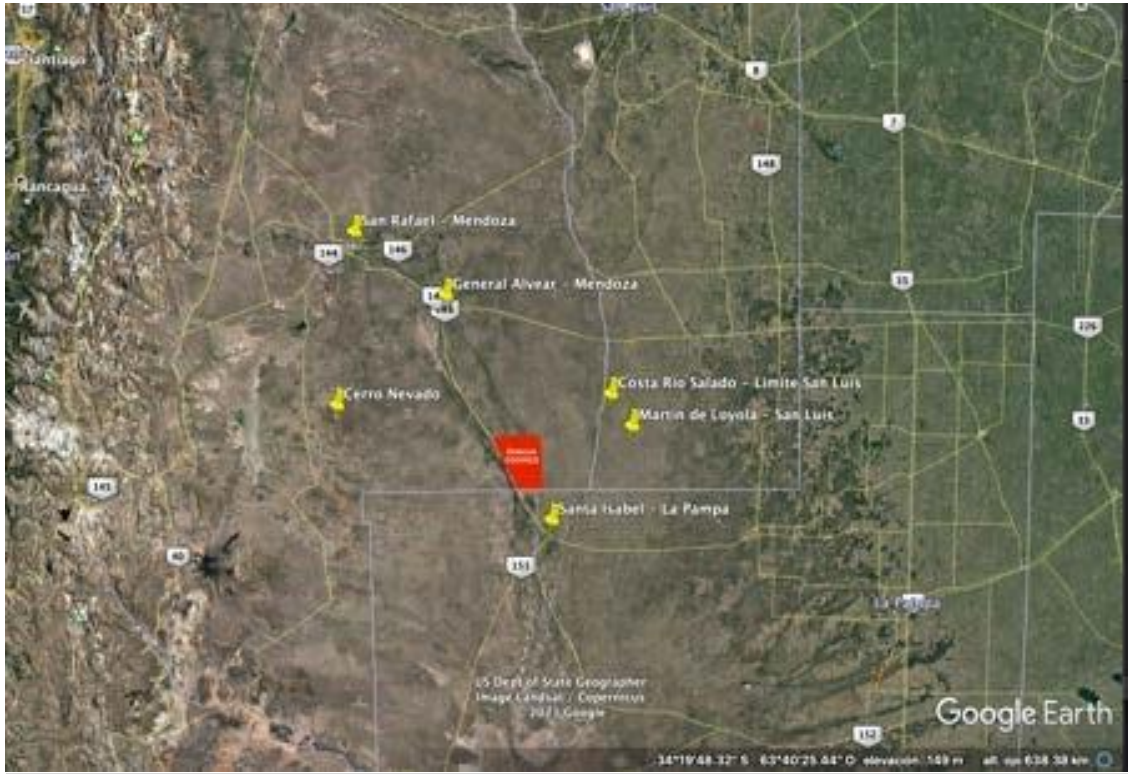
Casco principal Estancia Cochico. Con Luz 220V