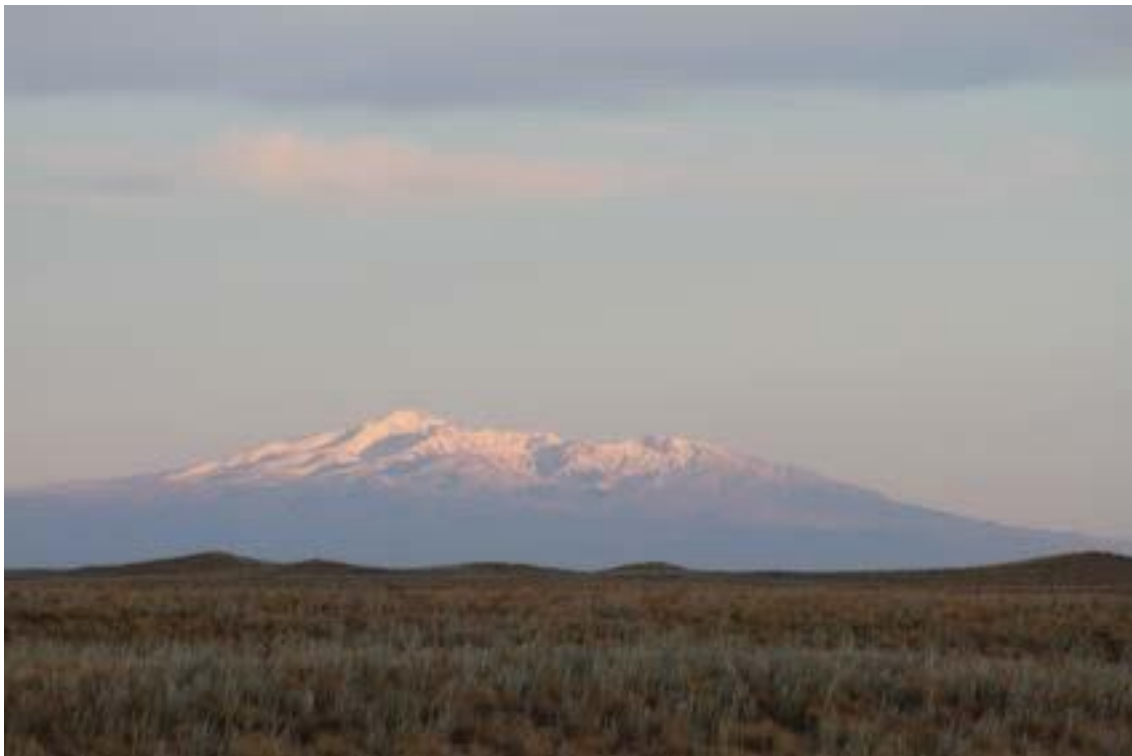
Foto del Cerro Nevado, sacada desde Estancia Cochico