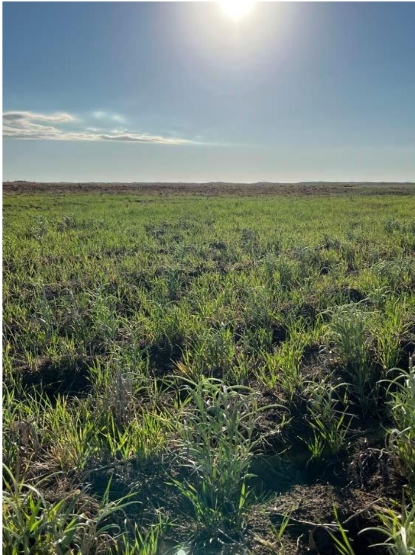
Siembra de Pasto Lloron en Travesia Año 2022: