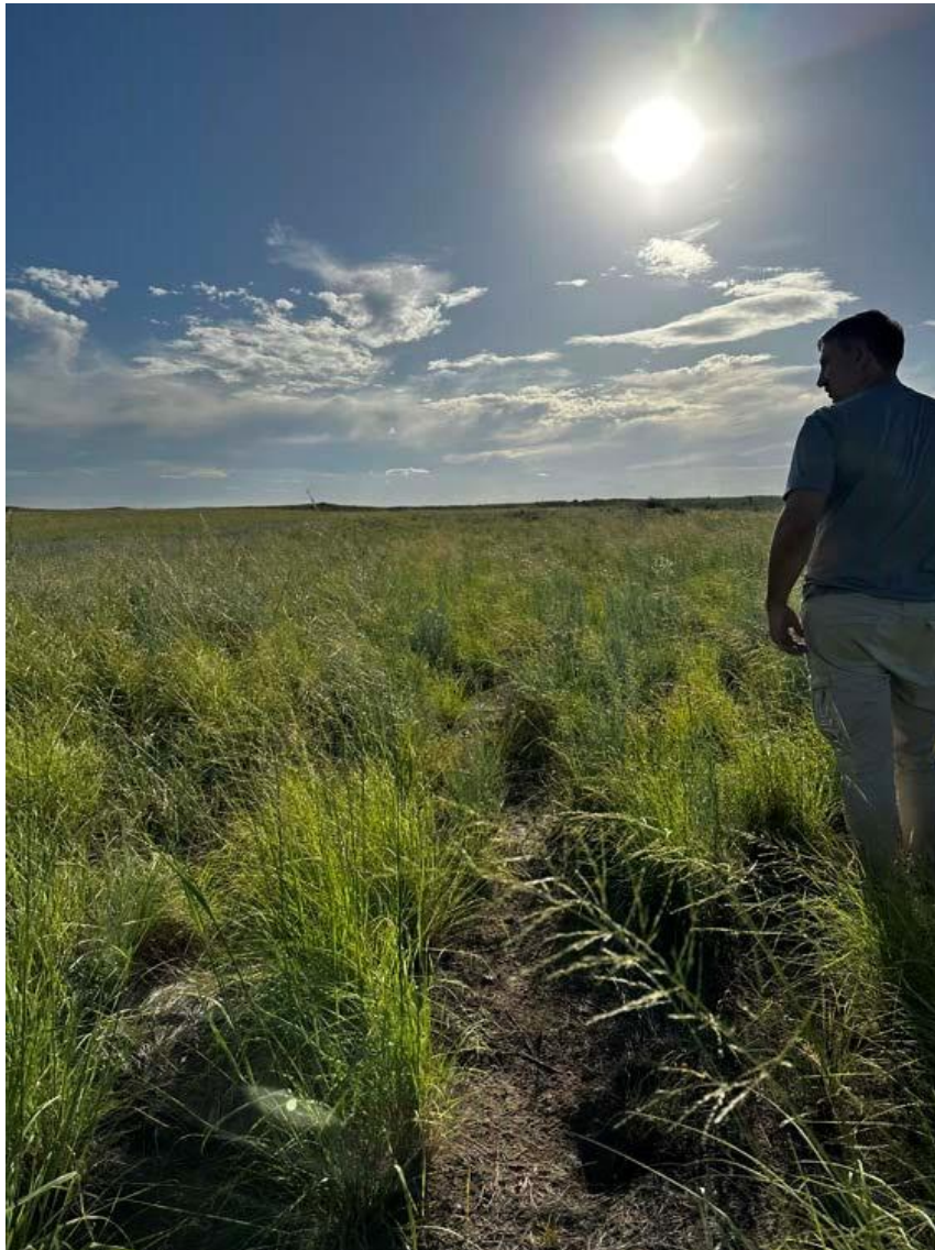
Siembra de Pasto DIGITARIA en Travesia Año 2022: